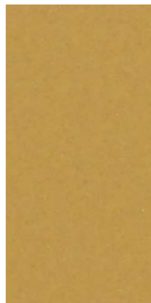
YY217E Gold Pearl