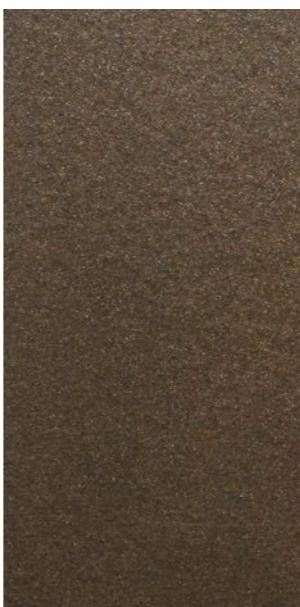
Y2214F Anodic Bronze