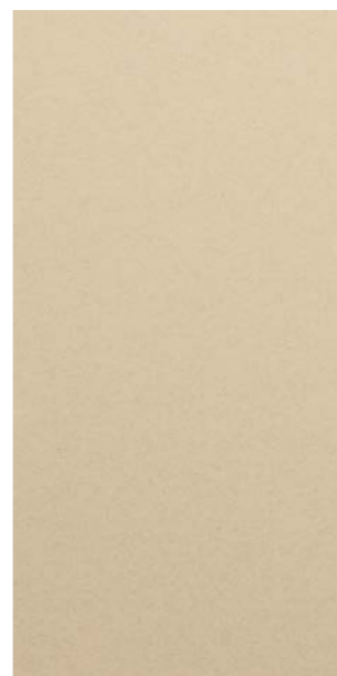
YW255F Golden Beach