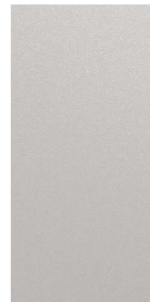
YW201E Anodic Ice