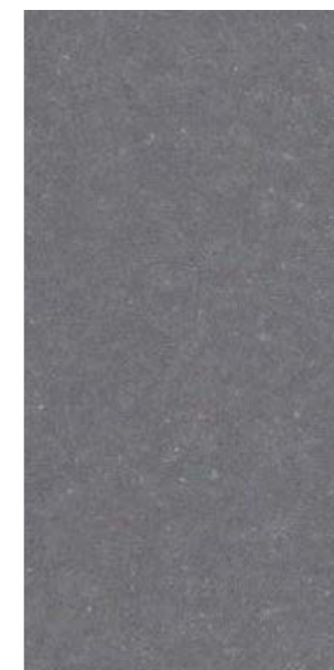
YX214E Steel Blue Gray 713