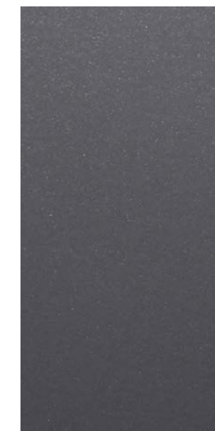
Y2215F Steel Blue Gray 715