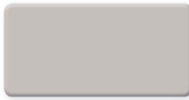
Quartz 2 AE03411122920